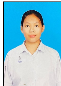
นักเรียนหญิง - เปิดหน้าผาก - เห็นใบหูทั้งสองข้าง