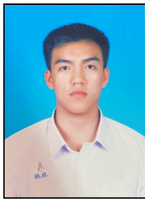
นักเรียนชาย - ผมสั้นตามระเบียบ

นักเรียนชาย - ผมสั้นตามระเบียบนักเรียนหญิง - เปิดหน้าผาก - เห็นใบหูทั้งสองข้าง